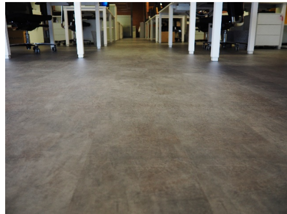
Loft Cement, Ref. 901 – The Stonist Collection

Cabe destacar que el continuo tránsito con residuos de hierro en el calzado de los operarios, pueden rayar o deteriorar ligeramente el decorativo del laminado. Aun así y tras las más duras exigencias de desgaste y durabilidad, la antiguo referencia de laminado compacto, se mantuvo en muy buenas condiciones durante más de 15 años.