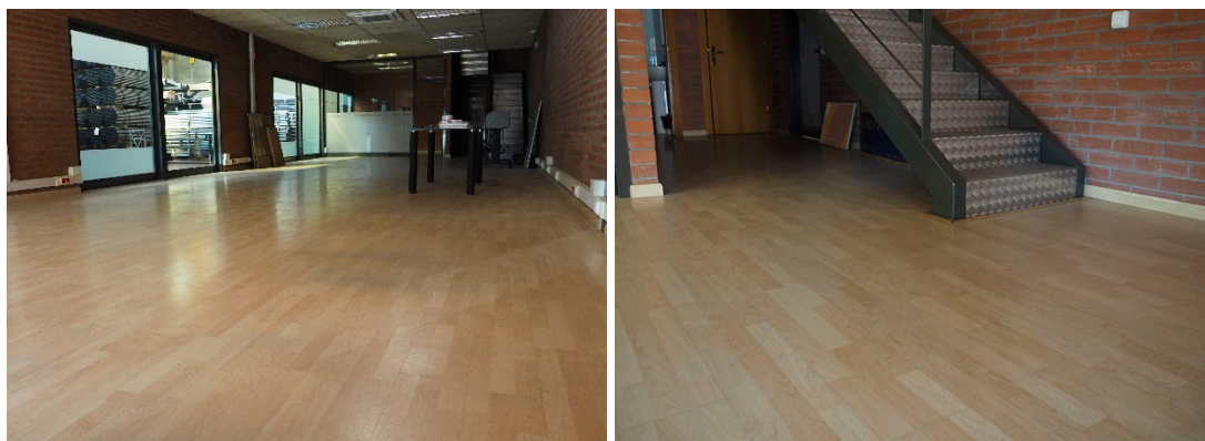
Isaba Maple, Ref. Descontinuada

CASO DE ÉXITO: Hace 15 años en PLANES instalan en sus oficinas el laminado con mejores características de resistencia y garantía en durabilidad del mercado, hoy día y como bien se refleja en las imágenes tomadas antes de la renovación, el laminado compacto HI-FLOOR by FLINT mantiene sus prestaciones y calidad tras tantos años de exigente tránsito.